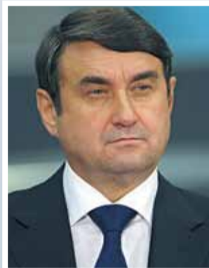
Левитин Игорь Евгеньевич 2015