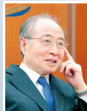
Ясуши Акаши 1989