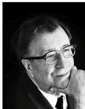
Птица Клавдий Борисович 1966