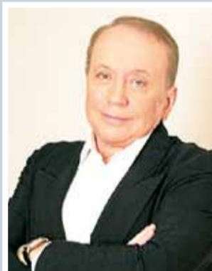
Масляков Александр Васильевич 2016