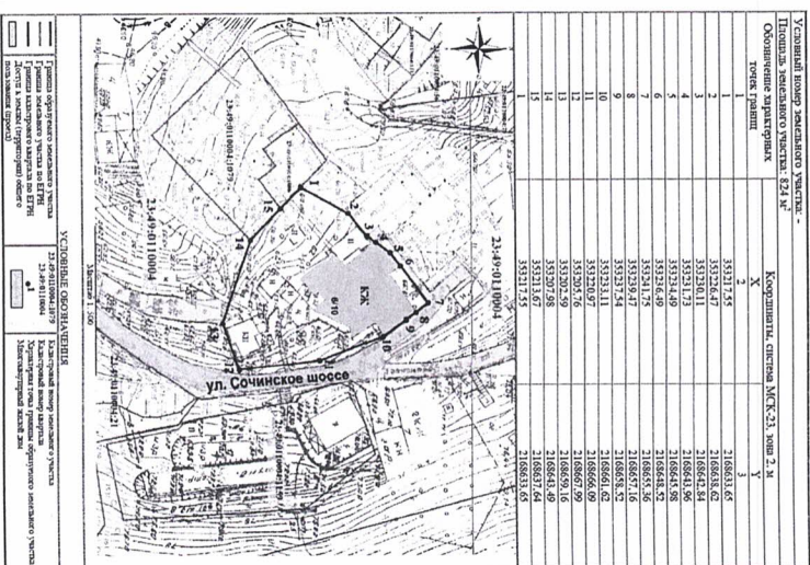
СХЕМА расположения земельного участка или земельных участков на кадастровом плане территории

Исполняющий обязанности директора департамента архитектуры и градостроительства администрации муниципального образования городской округ город-курорт Сочи Краснодарского края